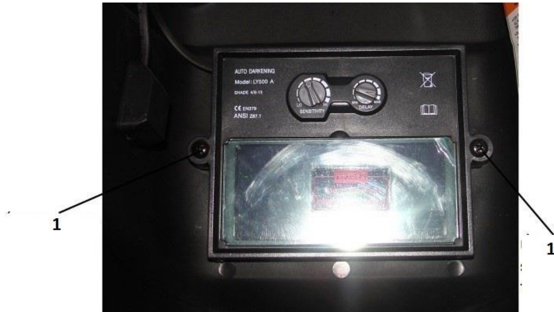
1. Szűrőkeret rögzítő csavar